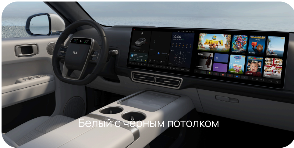
Белый с чёрным потолком