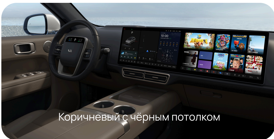
Коричневый с чёрным потолком