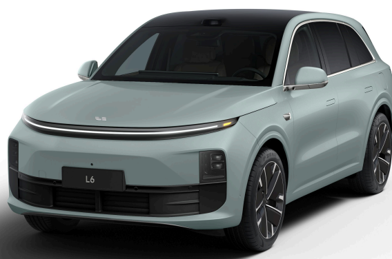
Мятно-голубой перламутровый - Особая серия 1