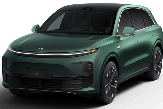
Глубокий зелёный перламутровый - Особая серия 1