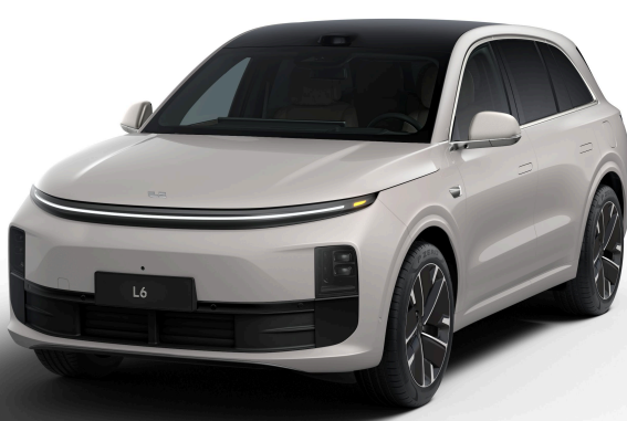
Серо-бежевый - Особая серия 1